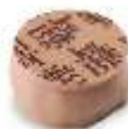
Chocolat ambré et ganache de chocolat noir au cacao d'Equateur