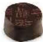
Chocolat noir 70% et ganache intense de chocolat noir au cacao du Venezuela

Jeff de Bruges a sélectionné des cacaos de grandes origines pour élaborer ces recettes de Palets. Saint Domingue, Venezuela, Equateur, Sao Tomé... parcourez un tour du monde de saveurs et succombez à cet assortiment de ganaches délicates et intenses réunies dans un coffret dégustation.