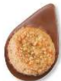
Biscuit citron combava