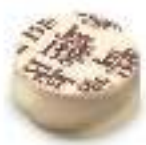
Chocolat blanc et puissante ganache de chocolat noir au cacao de Sao Tomé