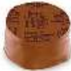
Chocolat au lait et ganache de chocolat au lait au cacao de Saint Domingue